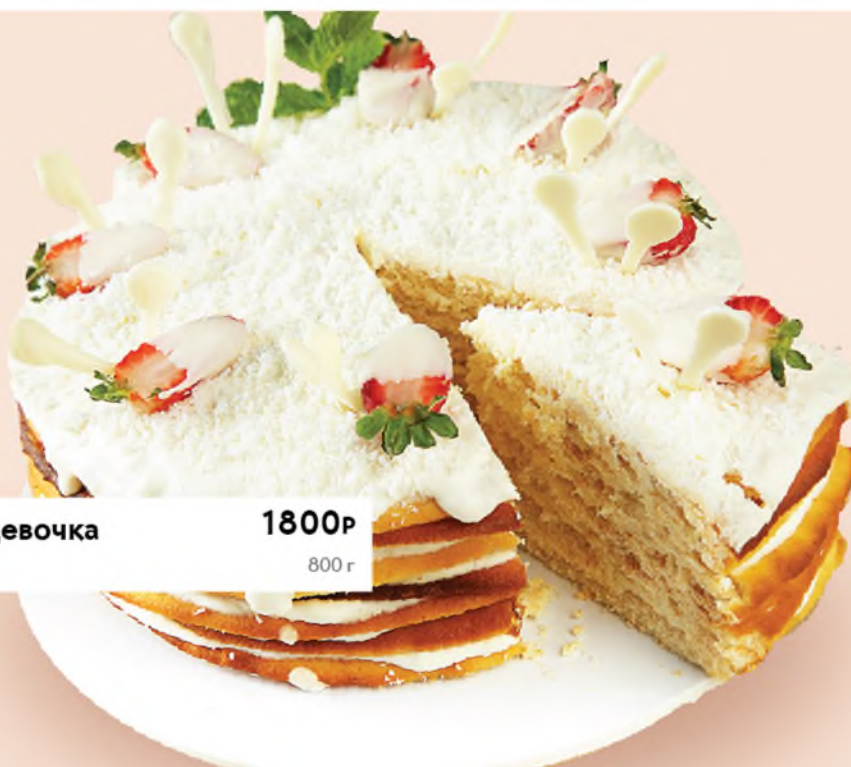
Молочная девочка Milkmaid