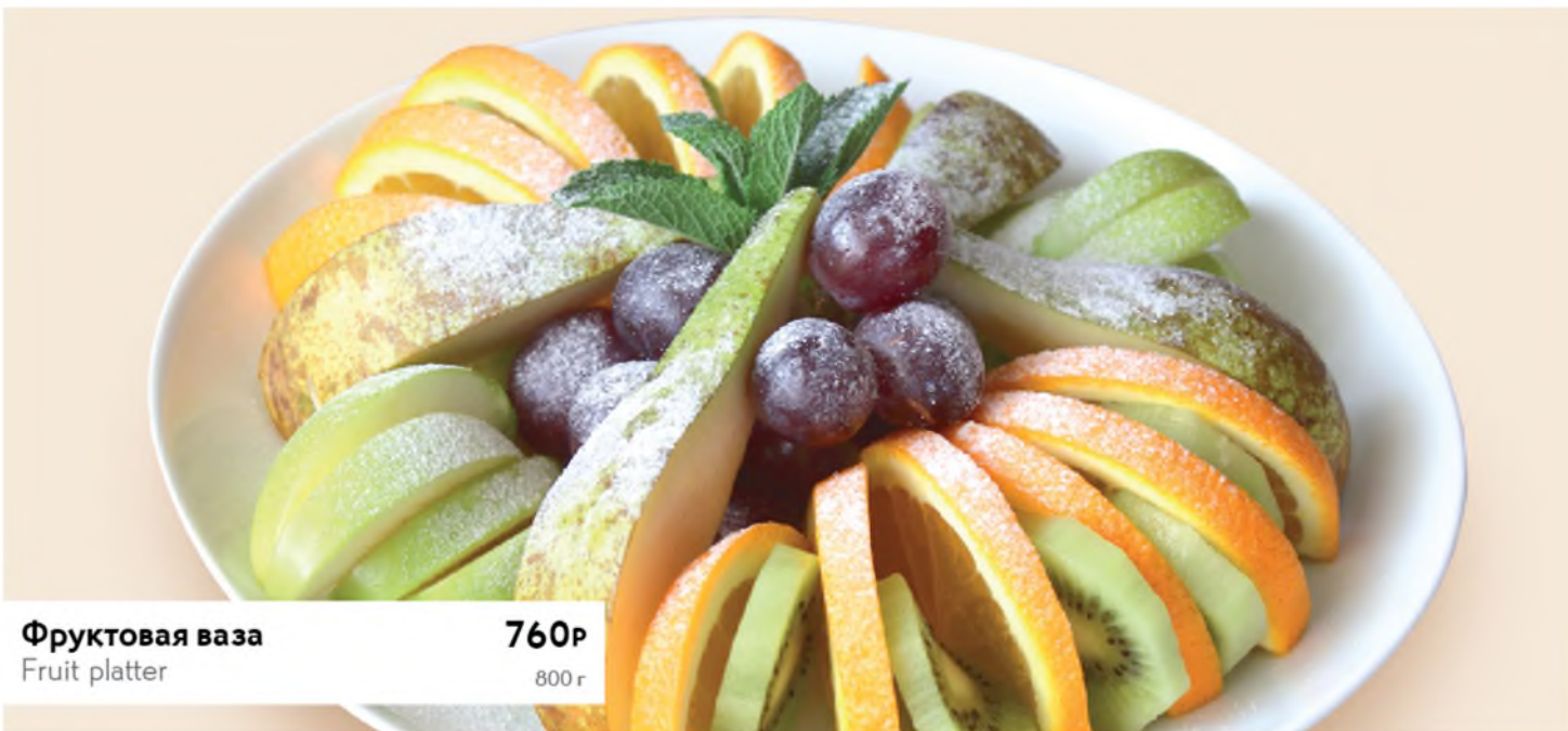
Фруктовая ваза Fruit platter