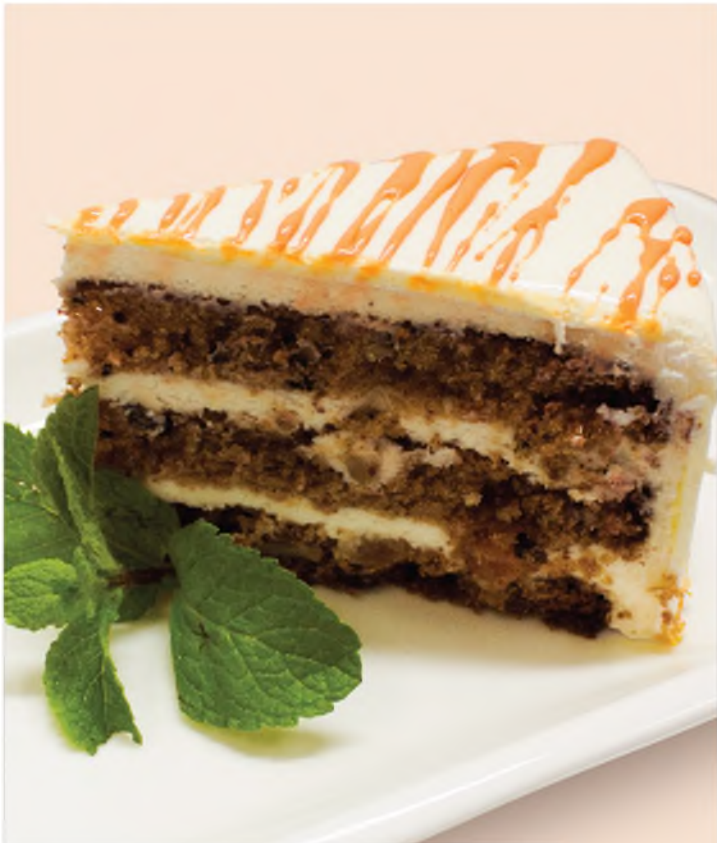
Морковный торт с кремом чиз