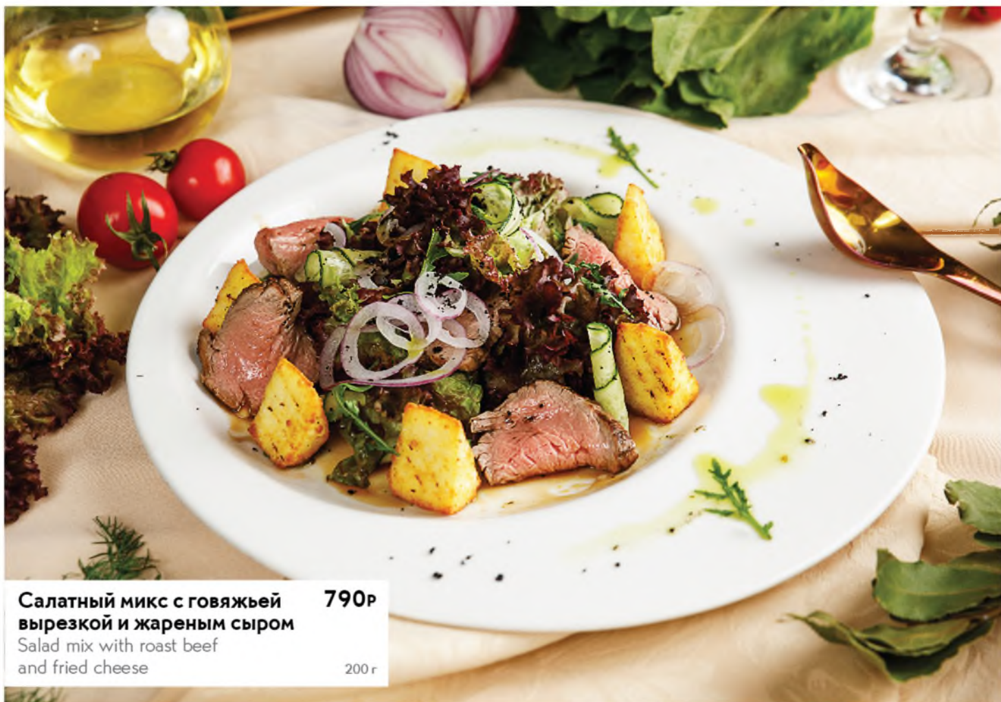
Салатный микс с говяжьей вырезкой и жареным сыром 790р Salad mix with roast beef and fried cheese 200 г