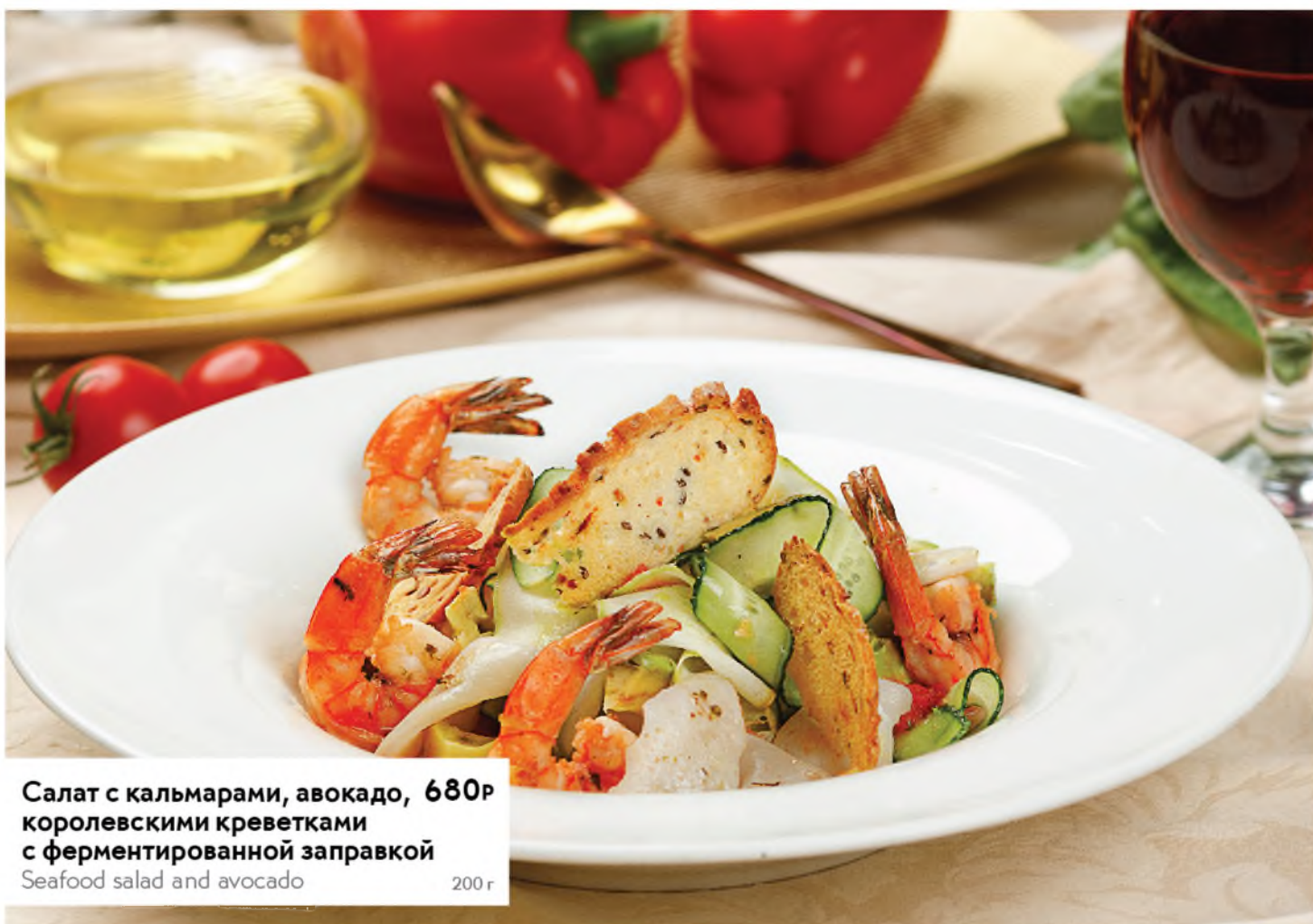
Салат с кальмарами, авокадо, 680Р королевскими креветками с ферментированной заправкой Seafood salad and avocado 200 г