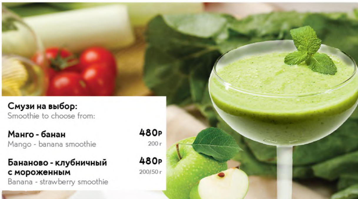
Смузи на выбор: Smoothie to choose from: