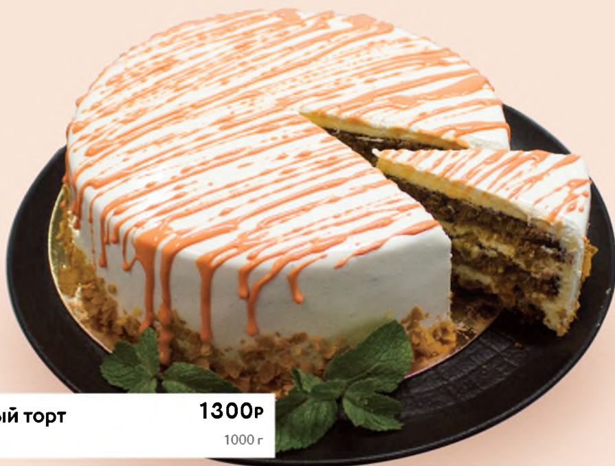
Морковный торт Carrot cake

ПРИЕМ ЗАКАЗОВ ОСУЩЕСТВЛЯЕТСЯ НЕ МЕНЕЕ ЧЕМ ЗА 48 ЧАСОВ