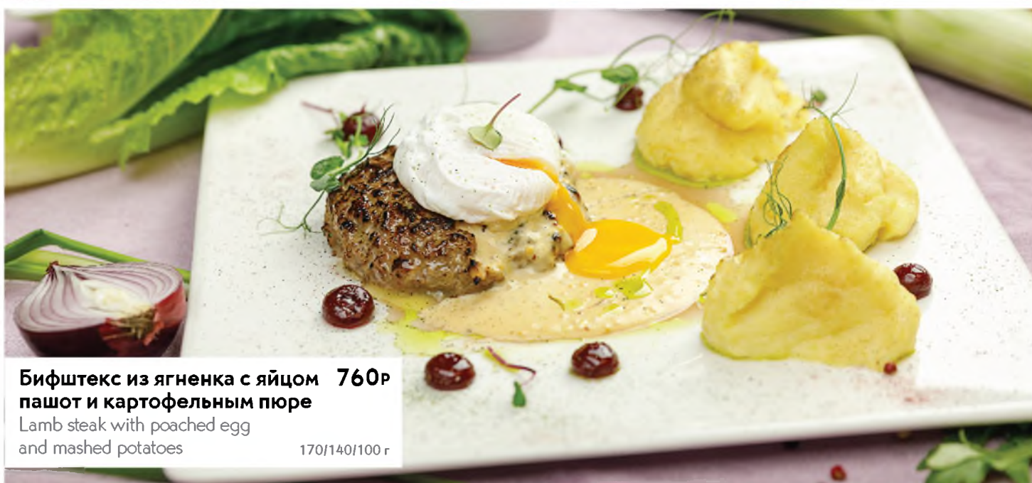
Биштекс из ягненка с яйцом пашот и картофельным пюре 760Р Lamb steak with poached egg and mashed potatoes 170/140/100 г