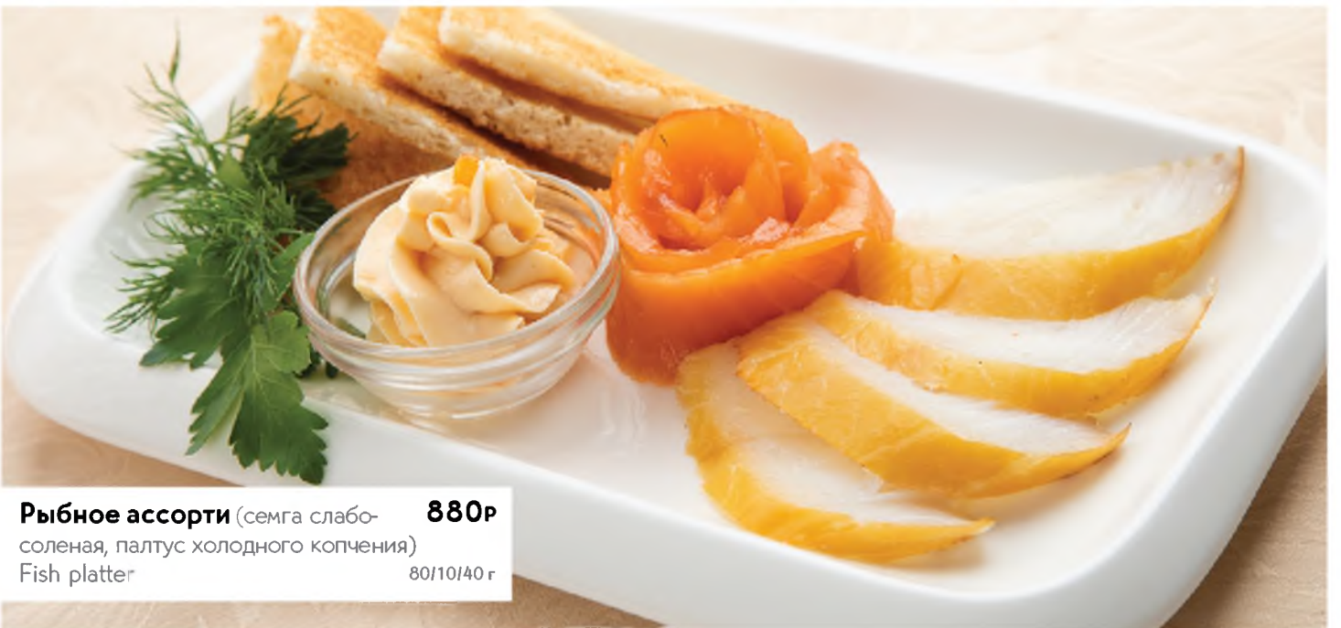
Рыбное ассорти (семга слабо-солёная, палтус холодного копчения) 880Р Fish platter 80/10/40 г

Если у вас есть аллергия на определенные продукты питания — сообщите об этом своему официанту. Please tell your waiter if you have any food allergy to certain products.