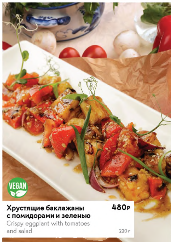
Хрустящие баклажаны с помидорами и зеленью 480р Crispy eggplant with tomatoes and salad 220 г

Возможна замена ингредиентов салатного микса в связи с сезоном. It is possible to change the ingredients of the salad mix due to the season.