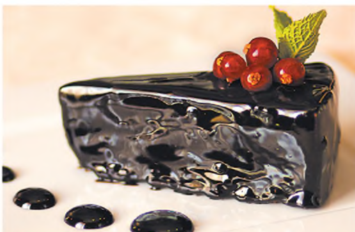
Блекджек - неповторимое сочетание воздушного мусса в шоколадной глазури Cake Blackjack