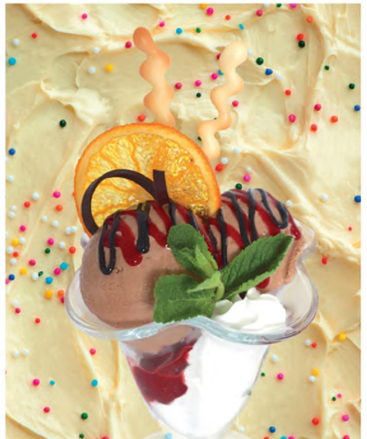
Мороженое Шоколатт Chocolate Ice-cream