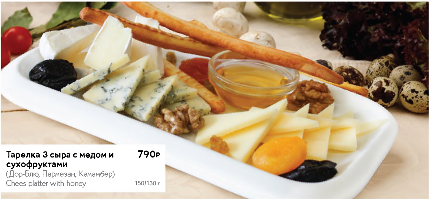
Тарелка 3 сыра с медом и сухофруктами 790Р (Дор-Блю, Пармезан, Камамбер) Chees platter with honey 150/130 г