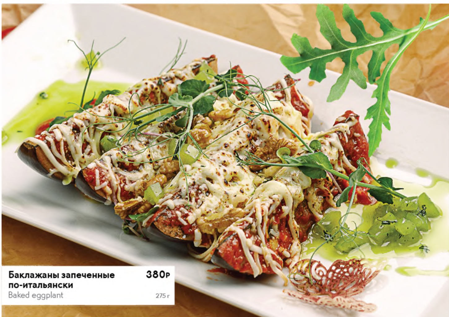
Баклажаны запеченные по-итальянски 380Р Baked eggplant 275 г

Если у вас есть аллергия на определенные продукты питания — сообщите об этом своему официанту. Please tell your waiter if you have any food allergy to certain products.