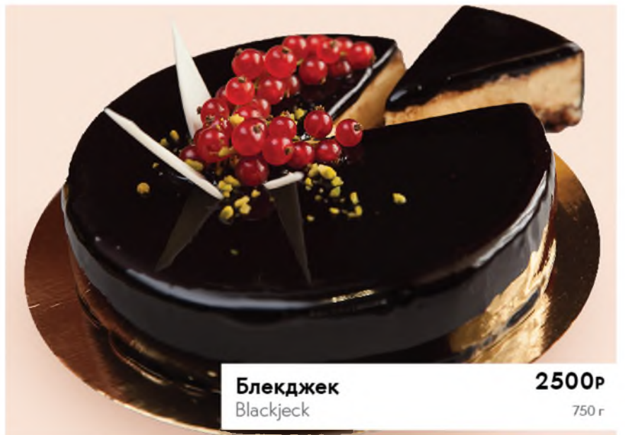
Блекджек 2500Р Blackjeck 750 г