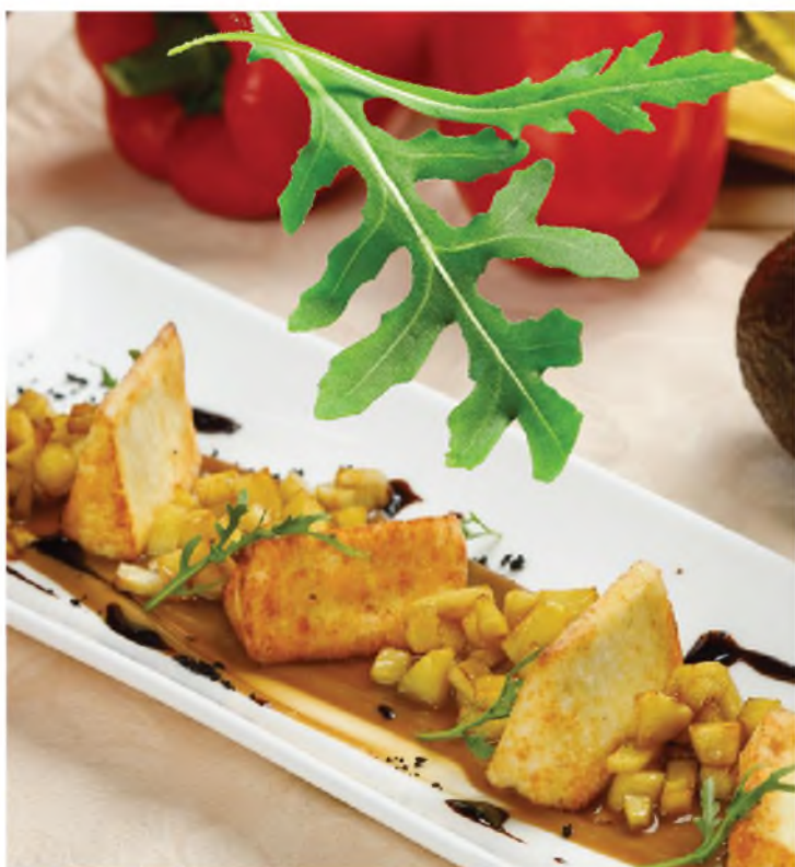
Сыр жареный домашний с кофейным соусом и яблочным чатни 420Р Homemade fried cheese with coffee sauce and apple chutney 250 г