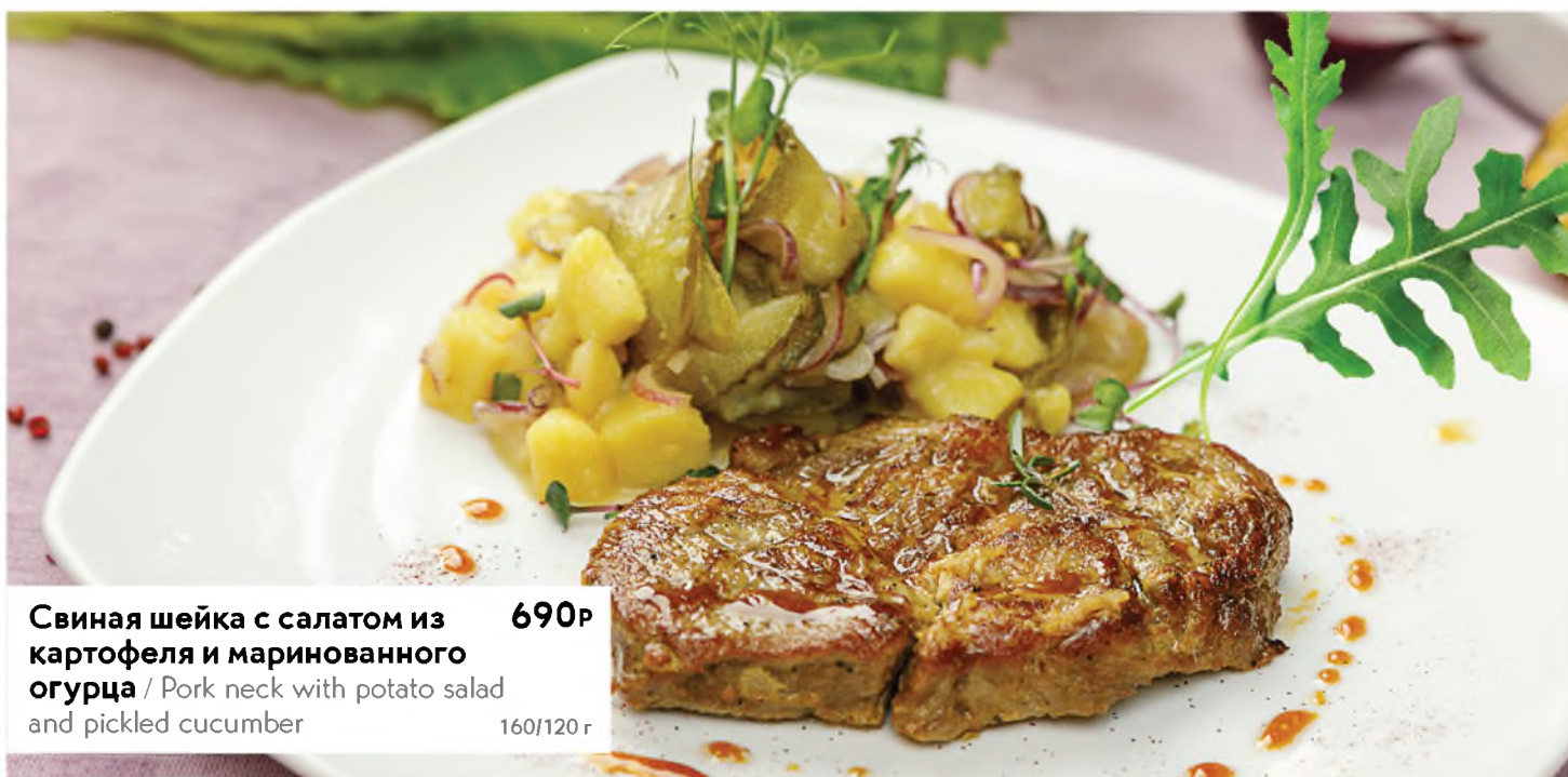
Свиная шейка с салатом из картофеля и маринованного огурца / Pork neck with potato salad and pickled cucumber 690Р 160/120 г