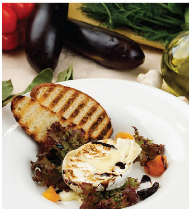
Обжаренный Камамбер с курагой, черносливом и миксом салатов 860Р Roasted Camembert with dried apricots, prunes and salad mix 300 г