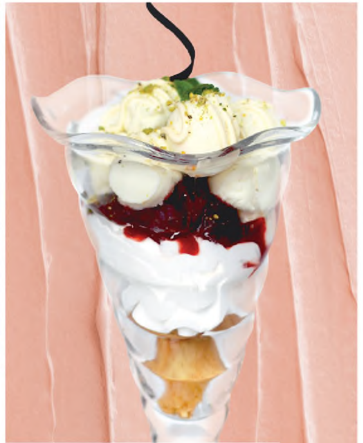
Мороженое Куршевель Courchevel Ice-cream