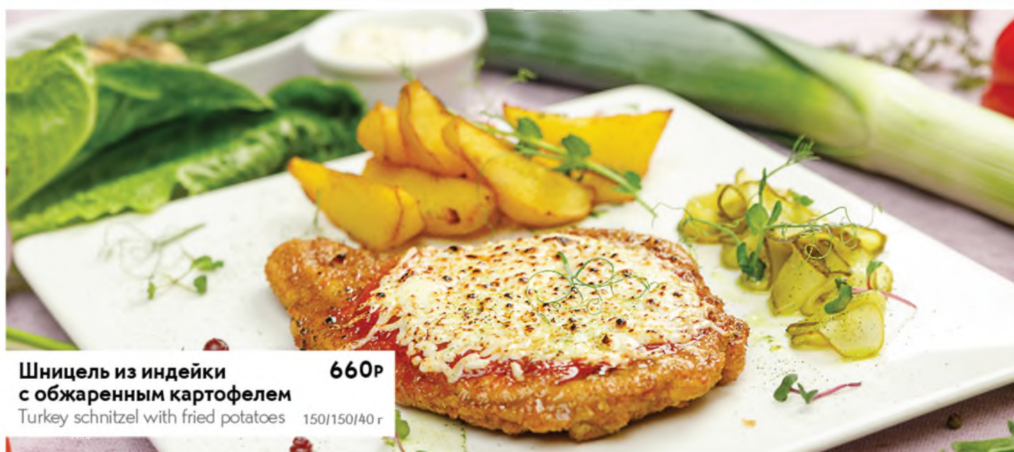
Шницель из индейки с обжаренным картофелем 660Р Turkey schnitzel with fried potatoes 150/150/40 г

Если у вас есть аллергия на определенные продукты питания — сообщите об этом своему официанту. Please tell your waiter if you have any food allergy to certain products.