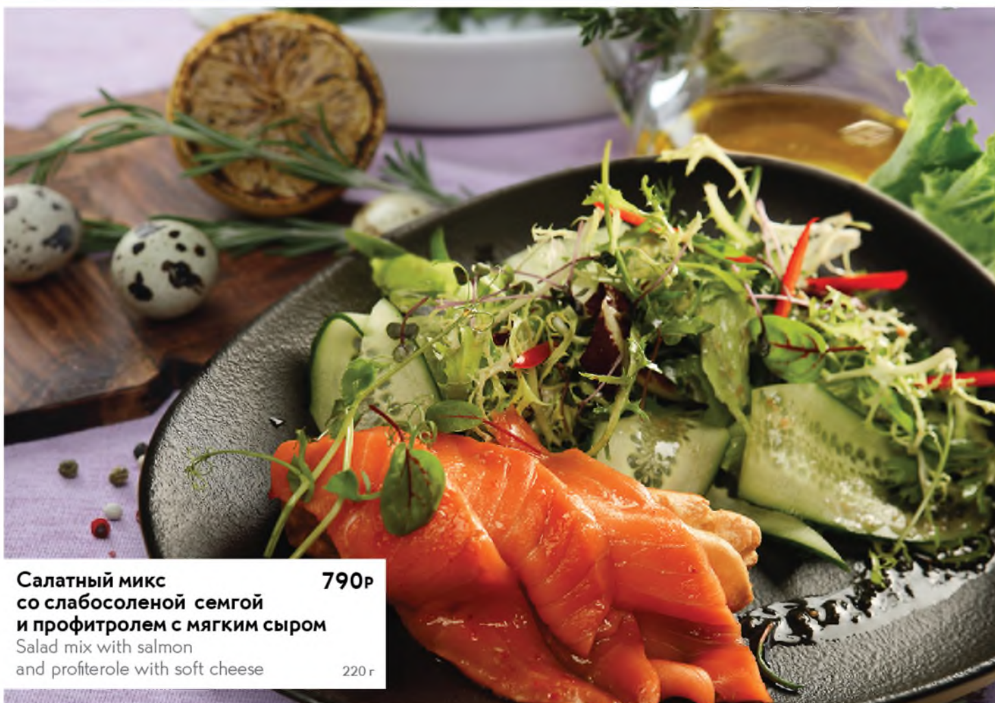
Салатный микс 790Р со слабосоленой семгой и профитролем с мягким сыром Salad mix with salmon and profiterole with soft cheese 220 г

Если у вас есть аллергия на определенные продукты питания — сообщите об этом своему официанту. Please tell your waiter if you have any food allergy to certain products.