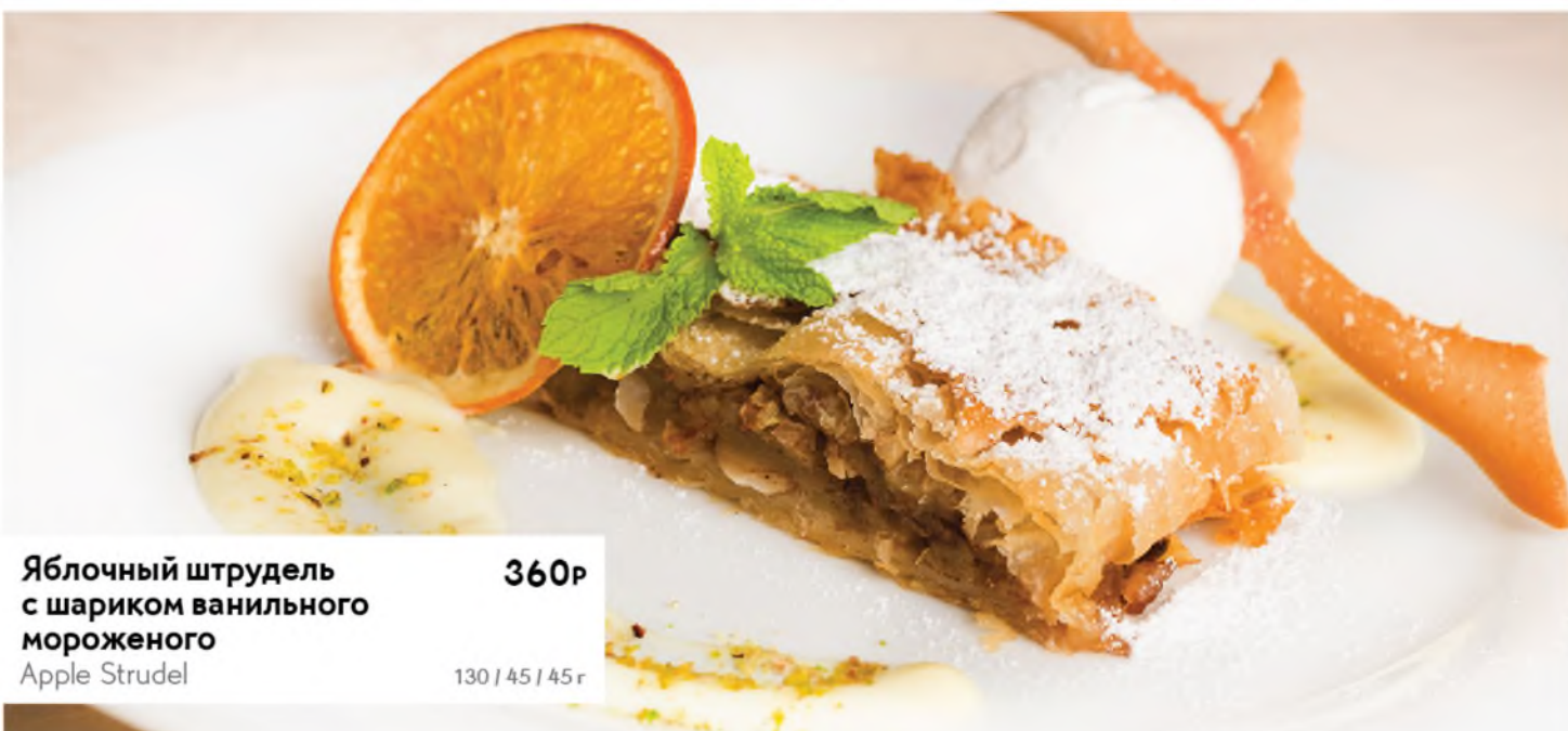
Яблочный штрудель с шариком ванильного мороженого Apple Strudel