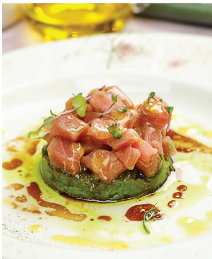
Тартар из тунца с гуакамоле 660Р Tuna Tartar with Guacamole 200 г