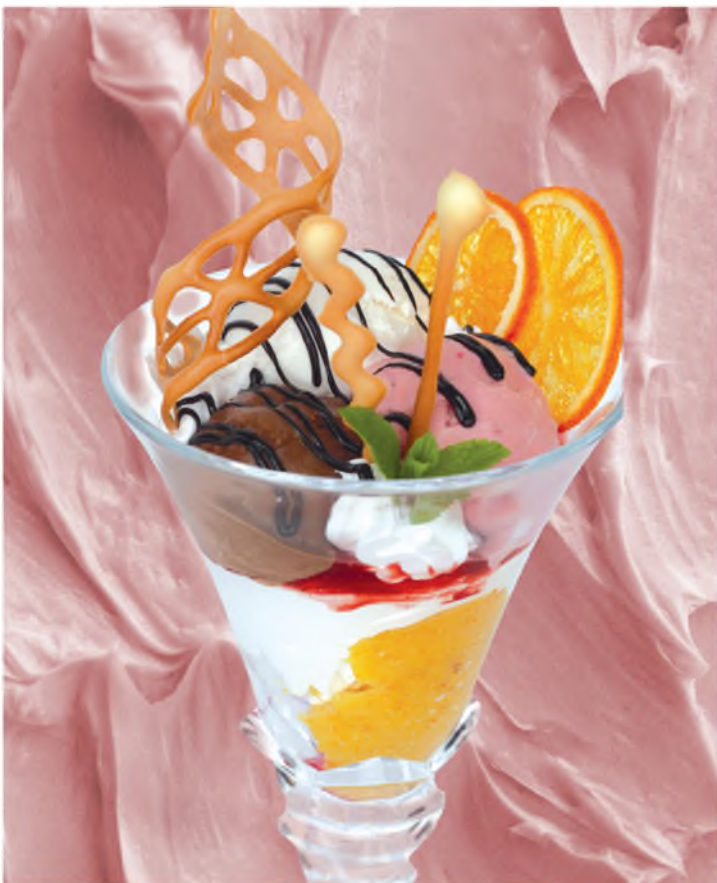
Мороженое Арлекино Harlequin Ice-cream