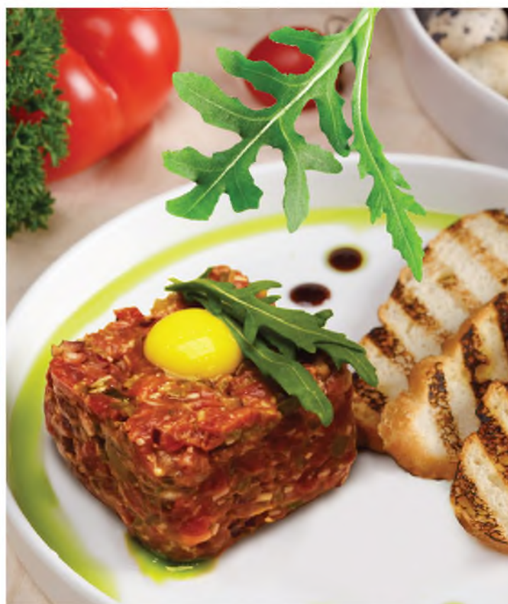
Тартар из фермерской 840Р говяжьей вырезки Farmhouse tartare beef tenderloin 100/100 г