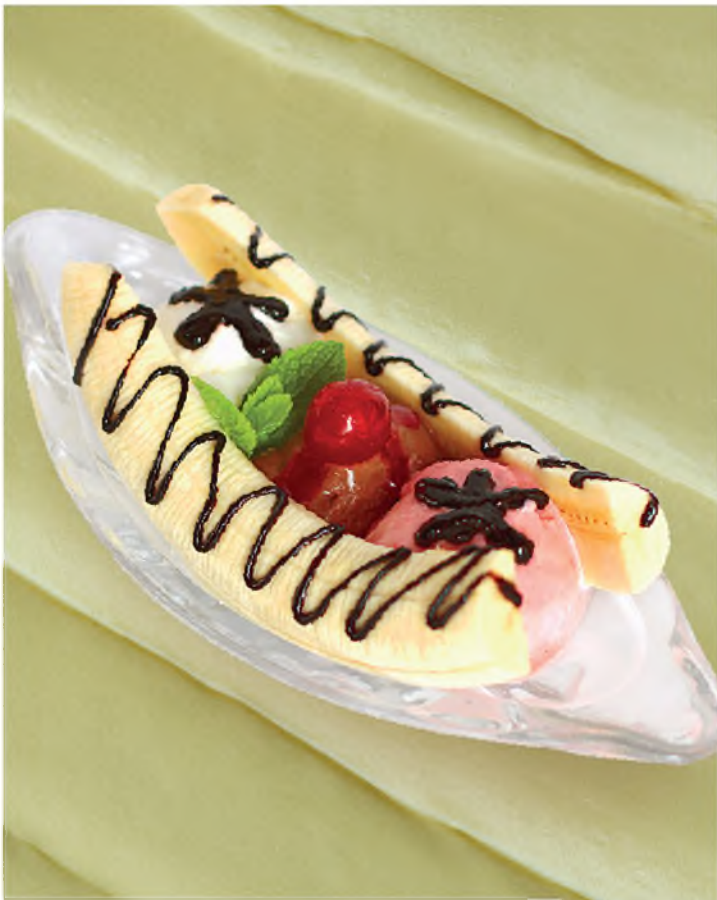
Банановый сплит Banana Split Ice-cream