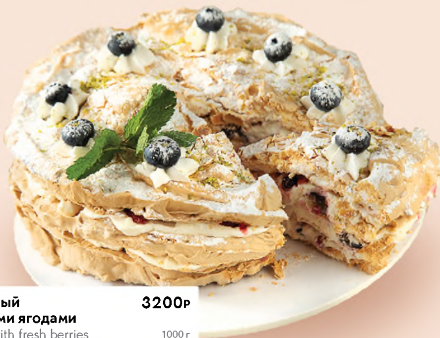
Меренговый со свежими ягодами Meringue with fresh berries