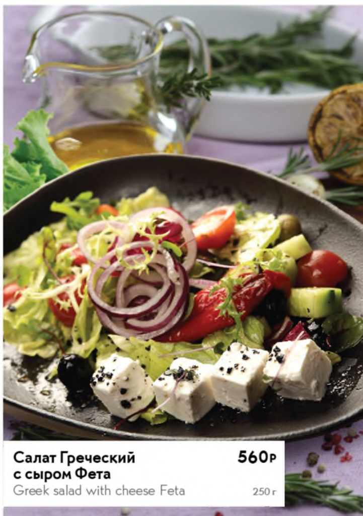
Салат Греческий с сыром Фета 560р Greek salad with cheese Feta 250 г