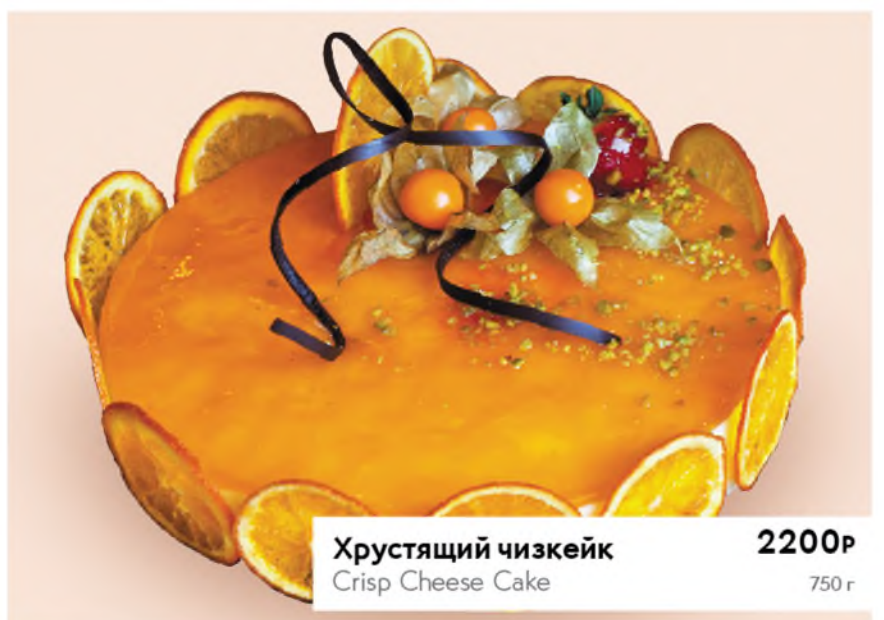
Хрустящий чизкейк 2200Р Crisp Cheese Cake 750 г

ПРИЕМ ЗАКАЗОВ: 8 (800) 201-35-49 / 8 (915) 088-31-26