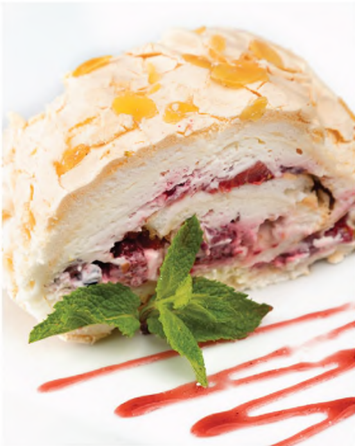
Меренговый рулет со свежими ягодами