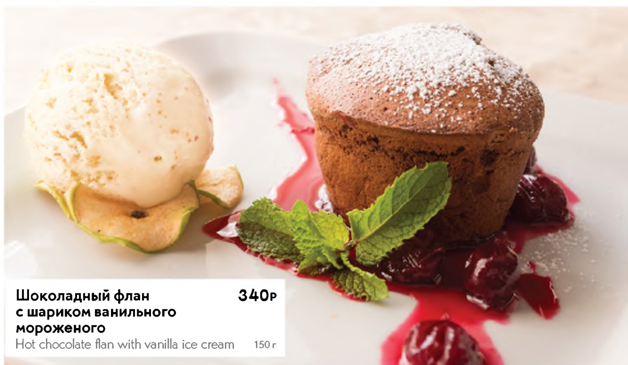
Шоколадный флан с шариком ванильного мороженого