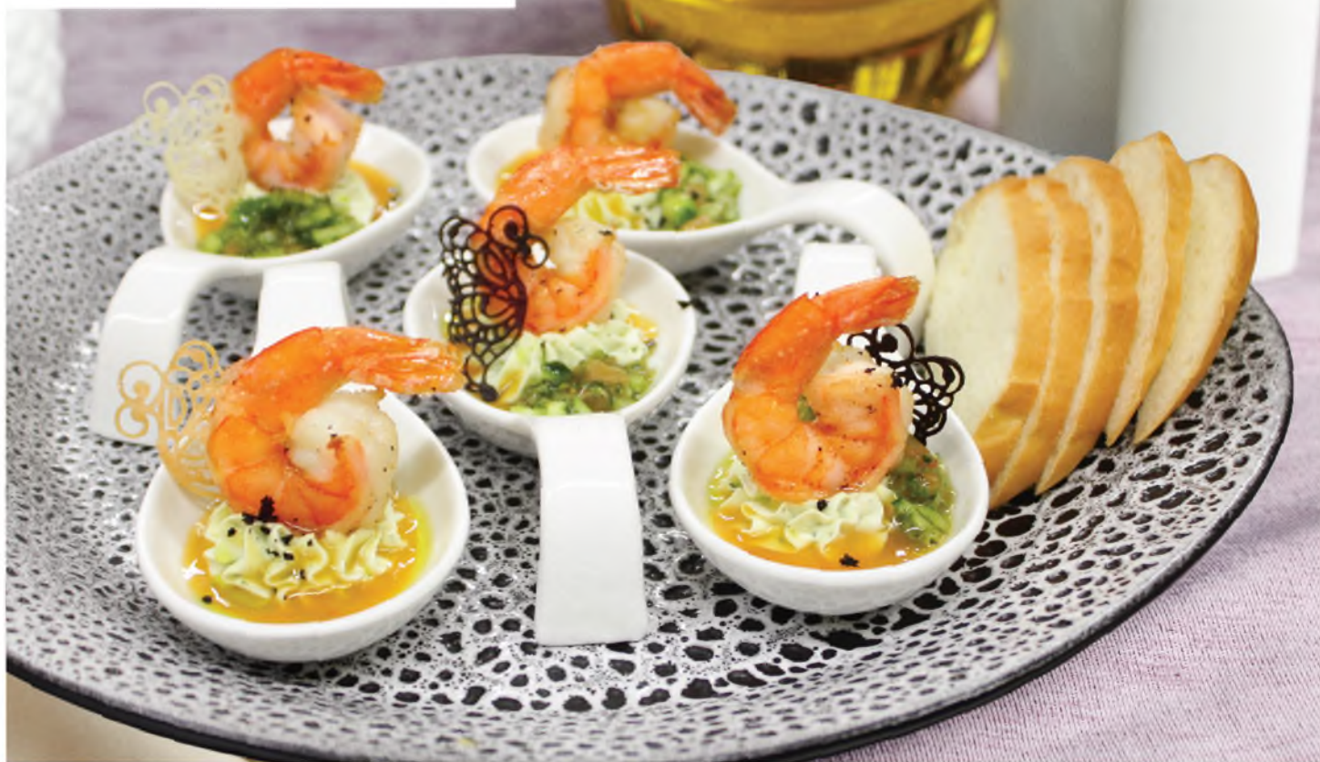
Тигровые креветки с соусом 860Р чили-манго и прованским муссом Shrimps with sauce chili-mango and Provence mousse 5 шт 250/30/40 г