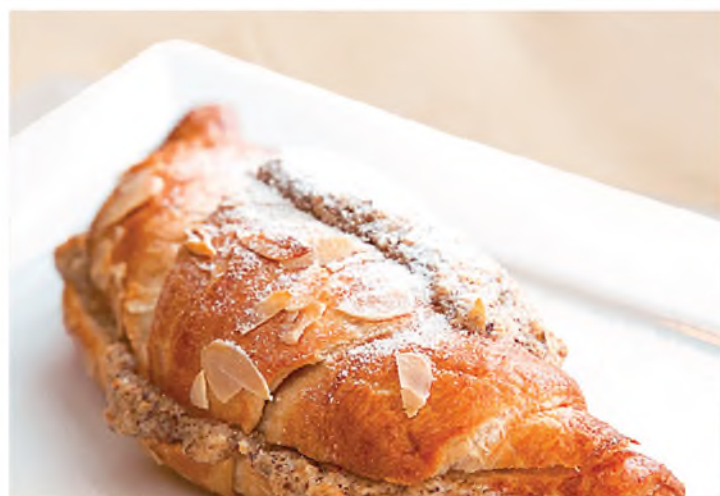
Горячий круассан с миндально-сливочной начинкой