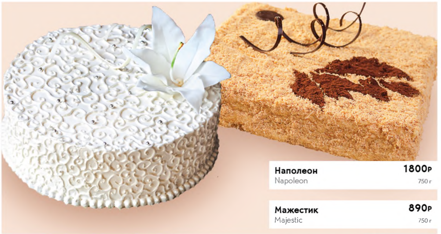
Наполеон 1800Р Napoleon 750 г