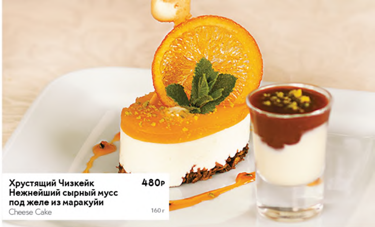
Хрустящий Чизкейк Нежнейший сырнй мусс под желе из маракуйи Cheese Cake