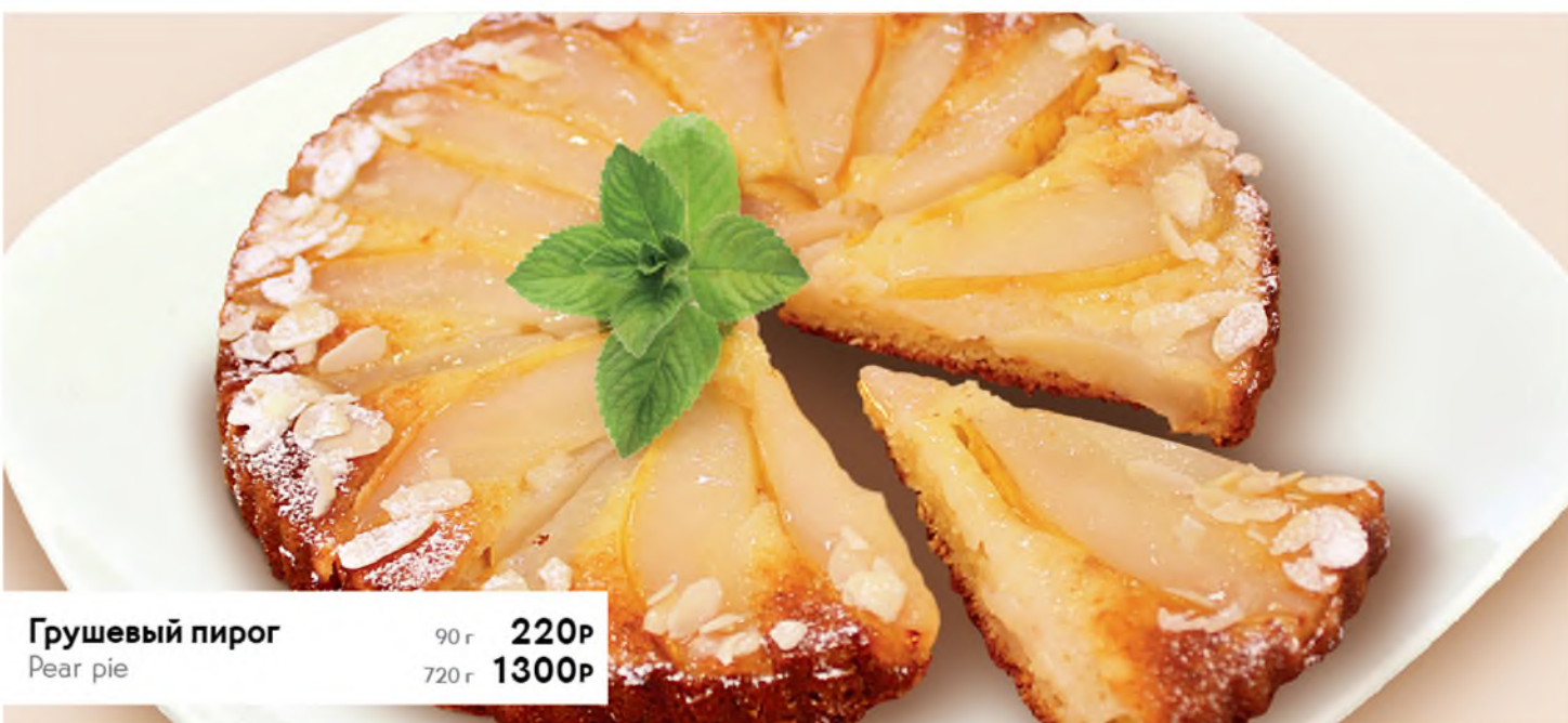
Грушевый пирог Pear pie