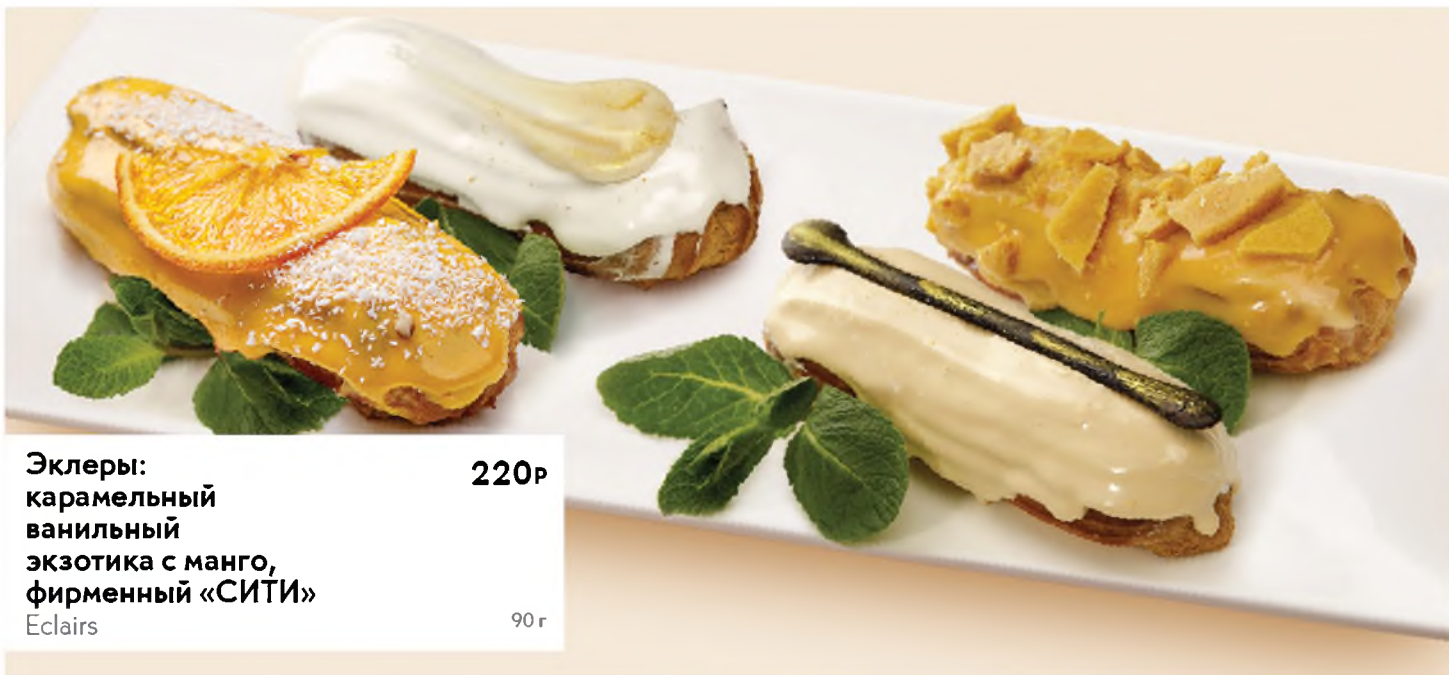
Эклеры: карамельный ванильный экзотика с манго, фирменный «СИТИ» Eclairs